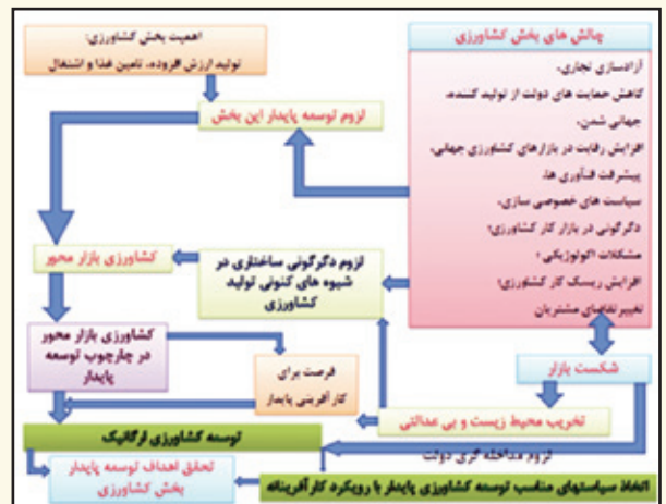
شکل (۱) - جایگاه کارآفرینی در توسعه کشاورزی ارگانیک و پایدار و ضرورت سیاست‌گذاری دولت

تمرکز این سیاست‌ها باید بر عوامل مختلف شامل توسعه فرصت‌های کارآفرینانه که توسعه کشاورزی ارگانیک خود به عنوان یک فرصت کارآفرینانه مطرح می‌باشد؛ توانمندسازی زنان و ایجاد انگیزه و مهارت برای کارآفرینی و کشاورزی ارگانیک، توسعه فرهنگ کارآفرینانه در سطح کشور و فرهنگ‌سازی نسبت به ارزش و جایگاه کارآفرینی زنان و ارائه مشوق‌ها اعم از مالی و معنوی برای توسعه کارآفرینی زنان به طریق پایدار باشد. در جدول (۱) برخی سیاست‌های موثر بر توسعه کارآفرینی پایدار در راستای توسعه کشاورزی ارگانیک توسط زنان کشاورز و تبدیل آن‌ها به «زنان کشاورز کارآفرین پایدار» مورد اشاره واقع شده‌اند.